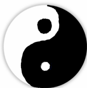
Fig.6 – Simbolizzazione di una predominanza, fisiologica o patologica

Inoltre, questa tradizionale rappresentazione frontale mostra sempre un perfetto equilibrio tra questi due principi antagonisti-complementari. Tuttavia, questo è ben lungi dall'essere il caso. Anche nel caso di una fisiologia perfetta, esso varia a seconda dei sistemi integrati di coordinazione neuromuscolare, che fanno sì che alcune articolazioni siano di carattere più dinamico, Yang, e altre, di carattere più statico, Yin. Inoltre, queste relazioni sono infinitamente variabili nel caso della patologia, rispondendo così a un altro dei nostri principi, quello dell'individualità. (Fig.6).