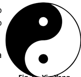
Fig.3 – Yin Yang

La primera declinación tangible de esta universalidad es la conocida bipolaridad antagónico-complementaria del Yin y el Yang (Fig. 3). Sus interpretaciones están en los orígenes de la acupuntura.