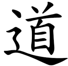
Fig.1 – Ortografía taoísta

Una tradición es particularmente útil para la interpretación de las infinitas variaciones bipolares de carácter más bien estático o más bien dinámico de nuestro sistema musculoesquelético, sus trastornos y para guiar nuestros tratamientos. Esto es el taoísmo (Fig.1).