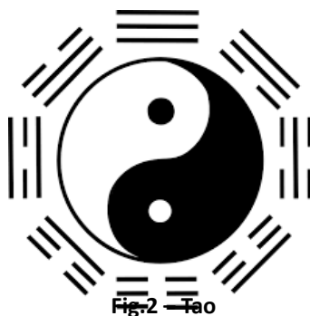
Fig.2 – Tao

El Tao nació en el año 206 a.C. El taoísmo, como religión, fue particularmente activo durante la dinastía Han del oeste de China (206 a.C. – 220 d.C.).